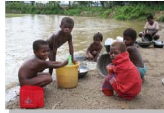
Waterputten, veestallen en visvijvers in kleine inheemse gemeenschappen in Papua-Barat, Indonesië

Box@kiaan 7 2042 2th Doors Telefoon: 0343 51 44 13 Fax: 0343 51 52 33 Bank: 3952 05 832 Giro: 712 47 57 KvK Utrecht nr. 18 78 12 www.schip.nl schip@planet.nl