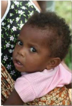
Project Moeder- en Kindzorg Papua-Barat, Indonesië